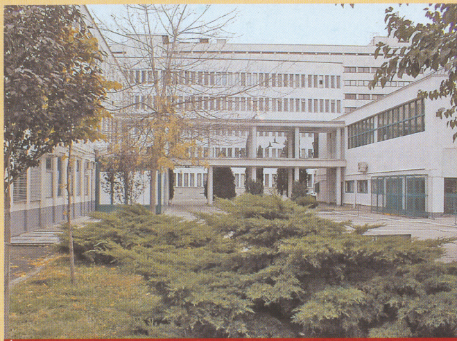
ÉMI KHT épülete és belső udvara

Az Építésügyi Minőségellenőrző Innovációs Közhasznú Társaság (ÉMI Kht.) az építésügy szellemi központja. Tevékenységünk kiterjed az építő- és építőanyagipar egész területére. Vizsgálattal, ellenőrzéssel és tanúsítással közreműködünk az építési termékek megfelelőségének igazolásában. Szakértői és tanácsadói tevékenységgel támogatjuk az építési szakterület résztvevőit. Tevékenységünket pártatlanul, befolyásmentesen, a megbízóra vonatkozó információkat bizalmasan kezelve, a szakmai titoktartás betartásával végezzük.